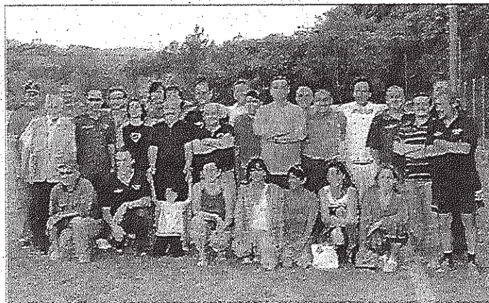
Gli organizzatori del torneo Città di Ceva